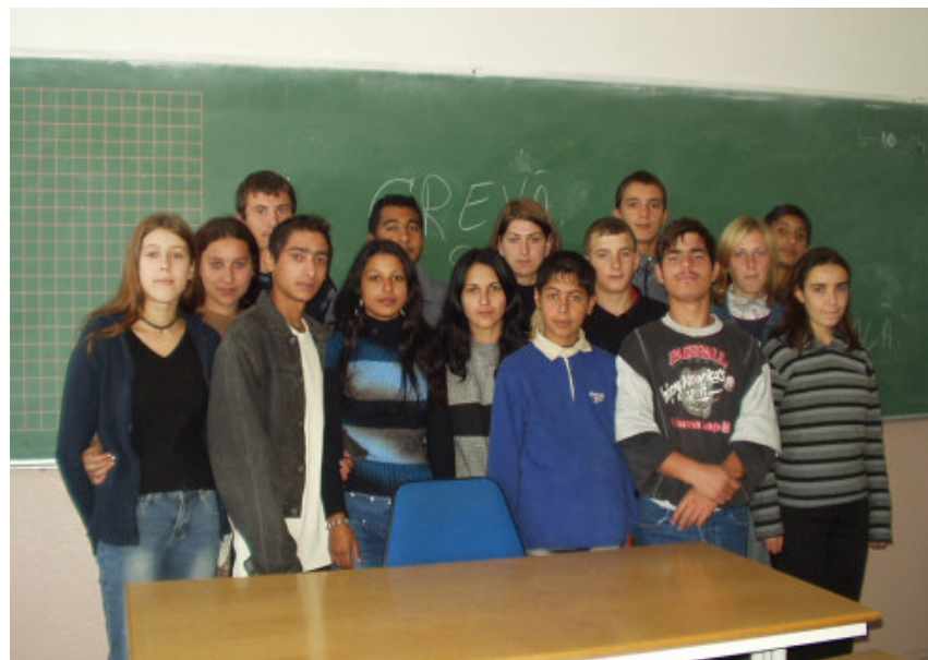
9. klasse 2004/05

Det koster kun 100,00 kr. pr. måned - samt et medlemskab af FSR. Ved et ja binder du dig kun, til eleven afslutter 10. klasse - altså blot 2 år.