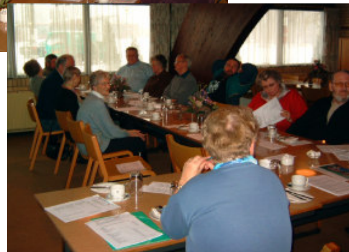
Regnskabet gennemgås, mens sneen daler ned udenfor

I skrivende stund savner jeg betaling af kontingent fra nogle af vore medlemmer. Girokortet er måske bortkommet – jeg vedlægger derfor et nyt med dette blad.