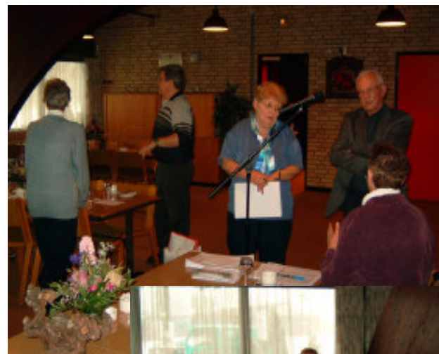
Klar til årsmøde nr. 2 lørdag den 12. februar 2005