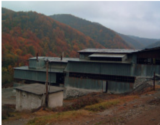
Nedlagt arbejdsplads i Dubova