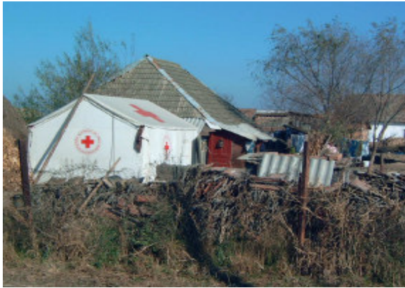
Forhåbentlig har familien fået tag over hovedet, inden vinteren sætter ind