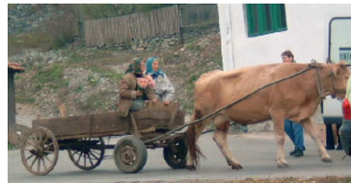
Oksekærre, prøv at se på hjulene

Til sidst sang alle med på sangen: En vals blev født i Wien og gik uden tvivl hjem med sød musik i øregangene