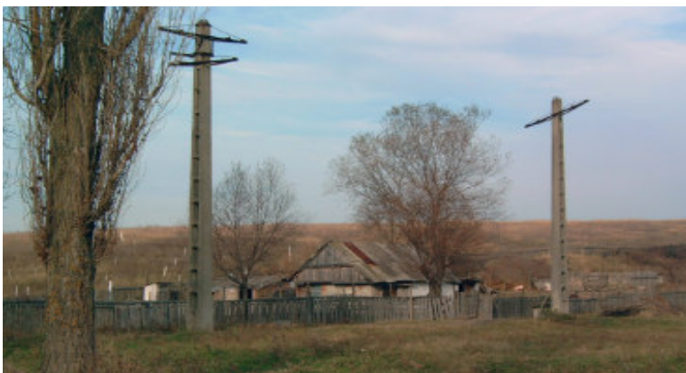
Landlig idyl, trænger til en kærlig hånd