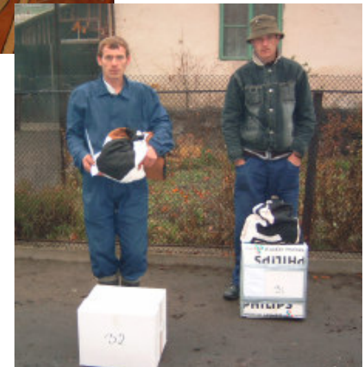
og her et par af modtagerne, 2 glade ungersvende i Baia Noua