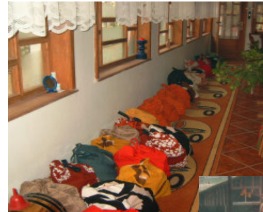
Her står poserne på rad og række, klar til at blive bragt ud .....

Var glæden stor hos de handlende, var den ikke mindre hos modtagerne.