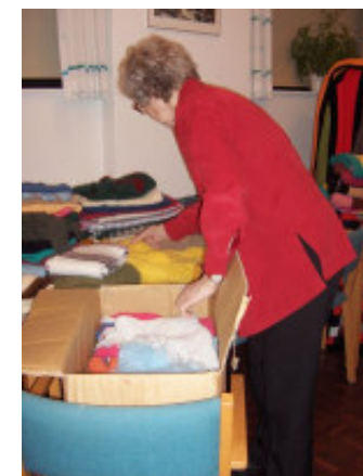
En stor tak til strikkedamerne for alle disse varme tæpper m.m.