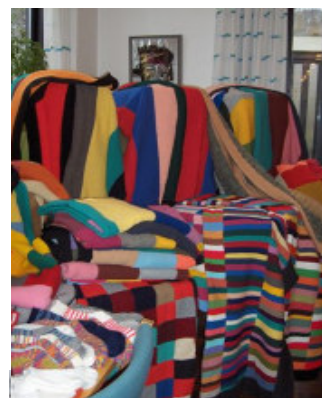
Bellahøj Kirke den 13.01.2006