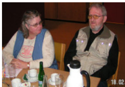
Årsmødet den 18.02.2006