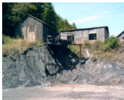
Minen i Baia Noua anno 2006

Lørdag kørte vi til Eibenthal, hvor vi havde en middagsaftale med vores egen familie kl. 14. Forinden var vi oppe ved minen i Baia Noua. Det var et trøstesløst syn. Den 7. august var der sket en sammenstyrtning i en mineskakt. Når man ser på minen med danske øjne skulle man tro, at man bliver sat 100 år tilbage i tiden. Ulykken havde kostet 2 mænd livet. Den ene var en ung familiefar fra FSR's arbejdsområde, en mand 29 år med kone og 2 små børn på 3 og 5 år. Præsten i Dubova bad om, at enken og børnene kunne komme med i FSR's adoptionsprogram. På stedet tilbød familien Krag at adoptere dem.