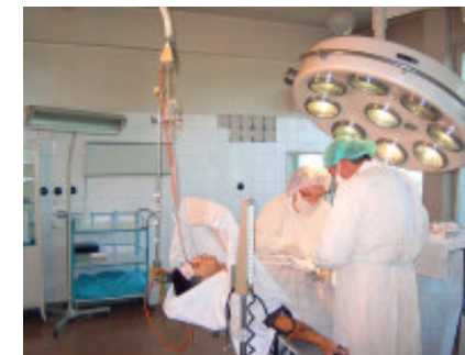
Av min blindtarm

Derefter var der rundvisning på hospitalet. Vi så bl.a. det nye røntgenlokale og -apparat i funktion. Vi så også operationsstuen, hvor man var midt i at fjerne en blindtarm.