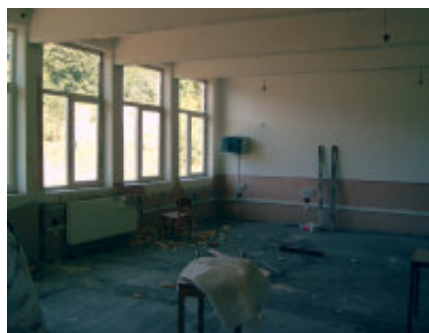
Nye vinduer og radiator

Vi skulle selvfølgelig også se skolen i Dubova. Igen blev vi positivt overraskede. Skolen er ved at gennemgå en større renovering, bl.a. også med støtte fra FSR. De gamle vinduer og døre er udskiftet, gulvene fornyes og der bliver installeret centralvarme. I alle klasseværelserne blev der arbejdet næsten i døgn drift for at blive færdig til skolestarten den 15. september.