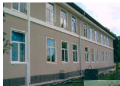
Skolen til gården og til gaden

Den 30. september kunne FSR mønstre 196 medlemmer.