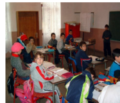
Kom bare ind

nogle flotte Barbiedukker og biler til læreren til fordeling mellem børnene. Det har med garanti gjort lykke. Da vi lidt senere kørte derfra, var der kun en enkelt dreng, der kunne afse tid til at vinke fra vinduet.