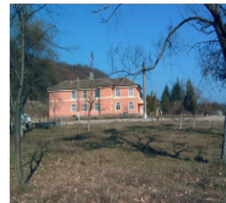
Noget af en overraskelse, den nymalede skole

Midt på eftermiddagen nåede vi Dubova fra Svinitsa-siden. Knejsende over byen så vi skolen. Den var næsten ikke til at kende igen. Den var blevet malet udvendig.