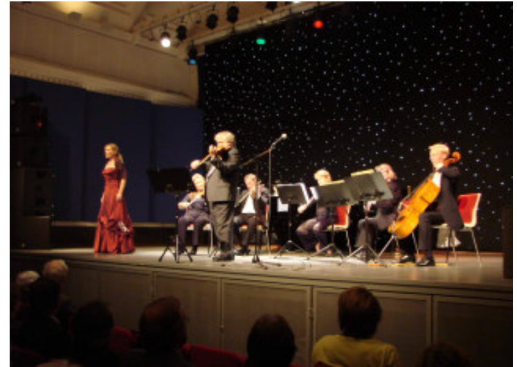
Wienerkoncerten den 22. november