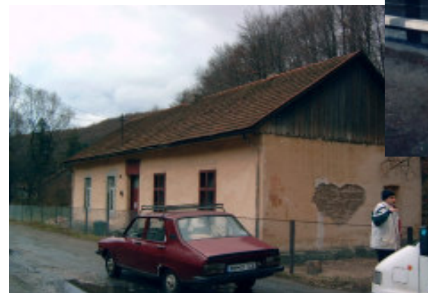
Skolen i Baia Noua. Bemærk hjertet i gavlen.