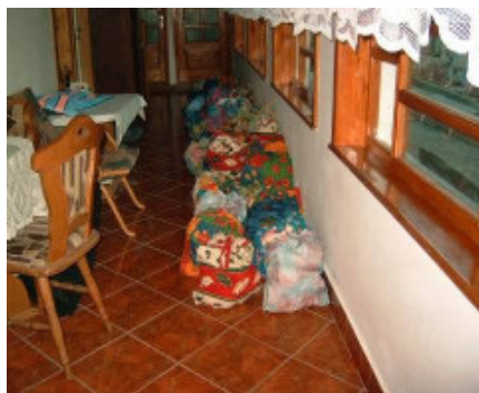
64 poser klar til udbringning