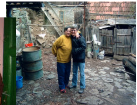
Bitten får en knuser af fru Osan