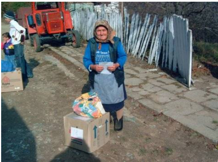
Hun kan næsten ikke vente på at åbne sin kasse

Andre var i skoven for at samle brænde til vinteren.