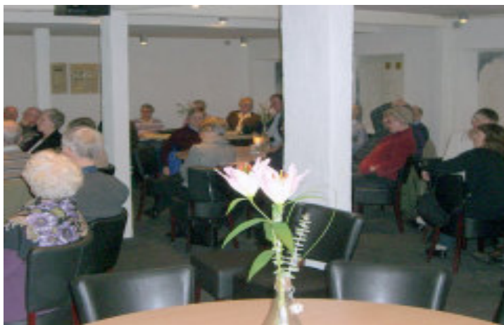
Årsmødet den 8. marts 2008