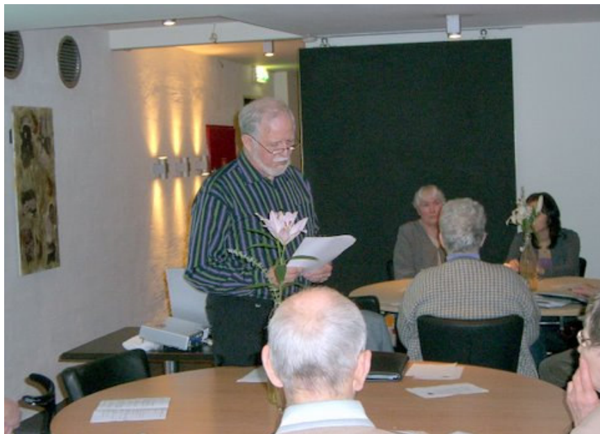
Erling aflægger beretning

Hele Erlings beretning kan læses på hjemmesiden. Her finder man også regnskabet for 2007.