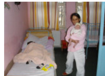
Mor, barn og gammel barselstue

Så efter sommerferien vil styregruppen forsøge at indsamle penge fra fonde og organisationer til en renovering af fødeafdelingen på hospitalet i Orsova.