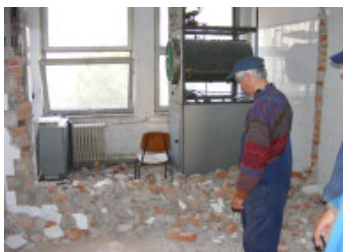
Først rives der ned.....

FSR har med hjælp fra bl.a. Lions Club Suså bidraget til ombygning af lokalerne.