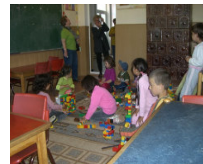
I børnehaveklassen leges der med Legoklodser

Mandag stillede vi alle i skolen kl. 9. Efter en rundvisning besøgte vi børnehaveklassen samt 1.-4. klasse.