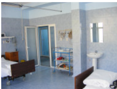
og her er den nye intensivafdeling

Onsdag besøgte vi Voditsa kloster lidt uden for Orsova samt St. Ana kloster, der knejser højt hævet over Orsova og Donau.