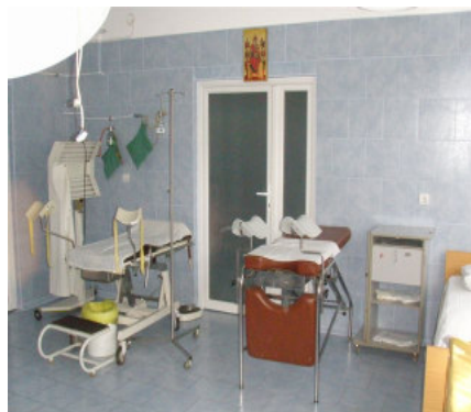
Den nyrenoverede føddestue

ke skal ammes. Mor og barn bliver på hospitalet en uges tid. Det skyldes mest, at de sanitære forhold i hjemmene oftest er meget dårlige.