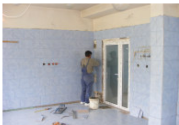
så mures der op og sættes fliser.....