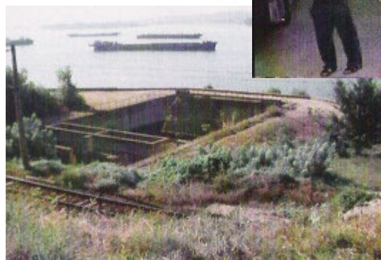
Billeder fra turen, kvaliteten er desværre ikke så god