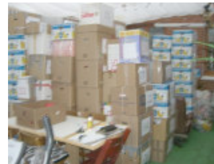
Vores udestue den 3.11.

Vi fik en lille lejlighed med fælles stue, dejligt badevæ-relse og et enkelt og et dob-