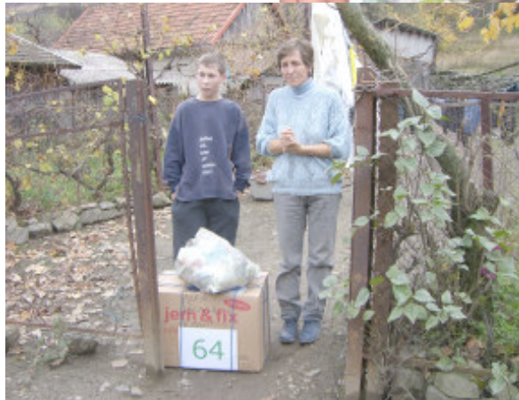
Enlig mor i Eibenthal