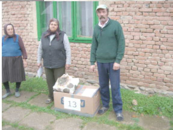
Fam. Ului foran huset, der trænger til at blive fuget