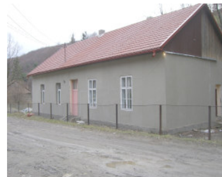
Skolen i Baia Noua under ombygning