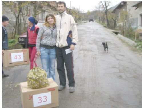
Ungt par uden arbejde