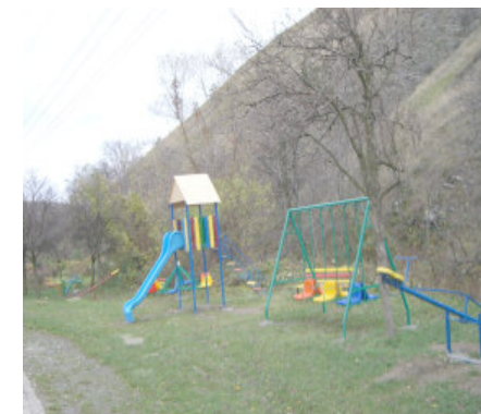
En af de nye legepladser

Skolen i Baia Noua, der tidligere nærmest lignede en ruin, var under ombygning, Væggene var pudset op, og der var ved at blive sat nye døre og vinduer i. Der var også kommet legepladser til børnene - dejlige legeredskaber i flotte farver.