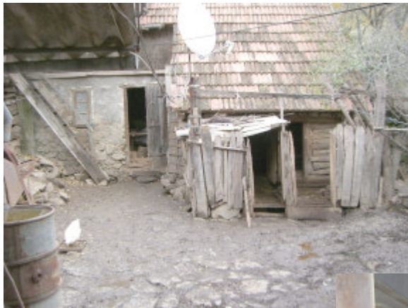
Kast et blik ind i denne gård