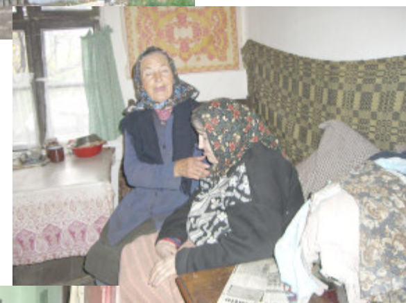
Mor og datter