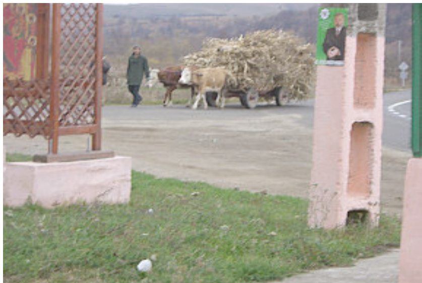
På hjemturen så vi mange oksekærrer, bl.a. denne fyldt med tørrede majsstokke..