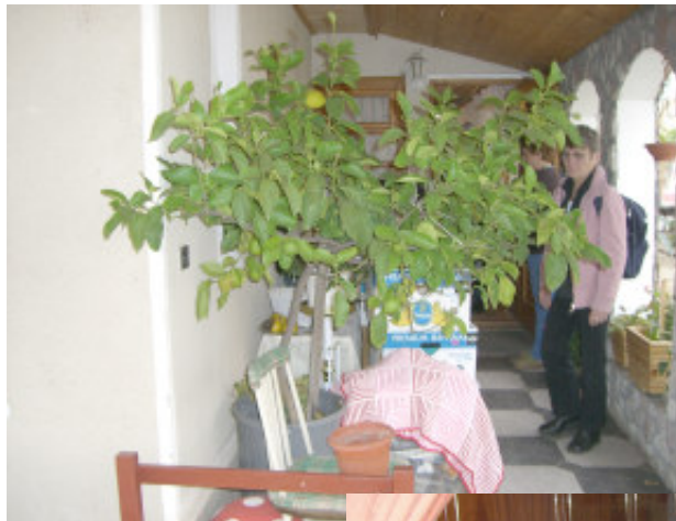
Carolinas citrontræ med flotte frugter i november