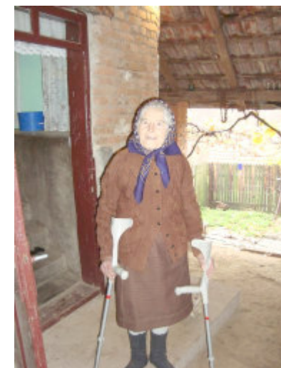
her er hun med sine nye krykker