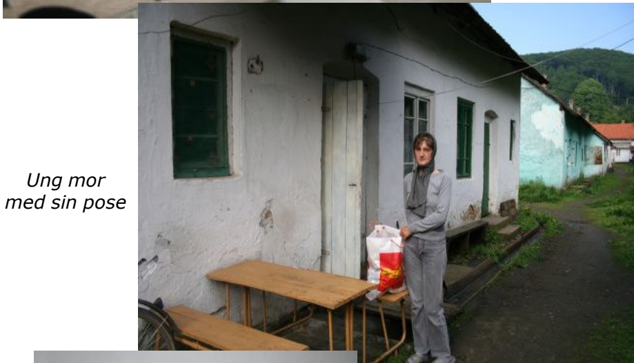
Ung mor med sin pose