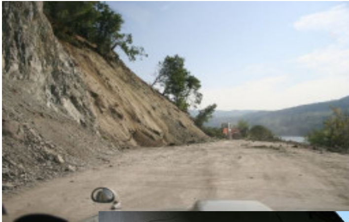
Den ødelagte vej, i baggrunden skimtes Donau