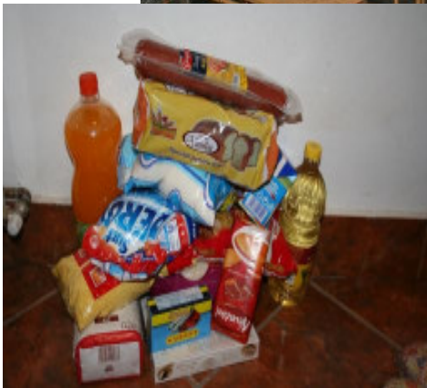
I maj måned så hjælpen således ud