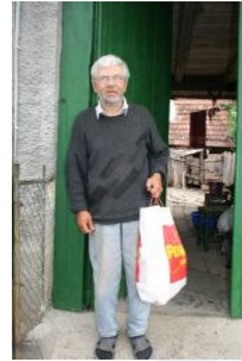
Mon ikke disse poser er kærkomne?