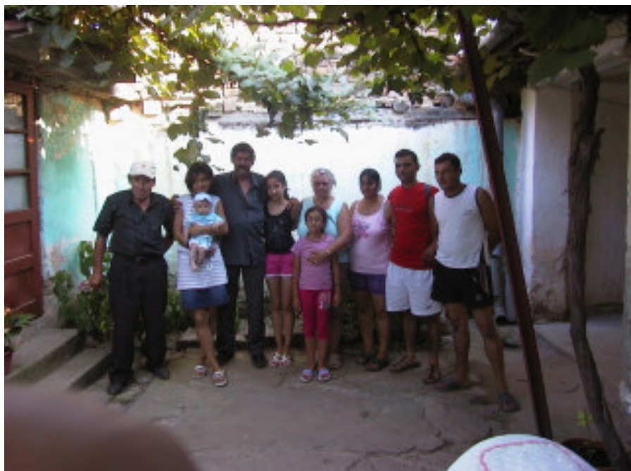
Her står vi så alle på rad og række