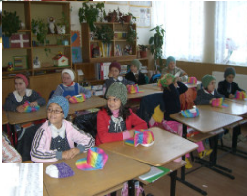
Nye huer til hele klassen