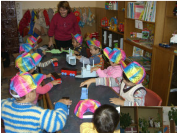
Nye kasketter og nyt legetøj