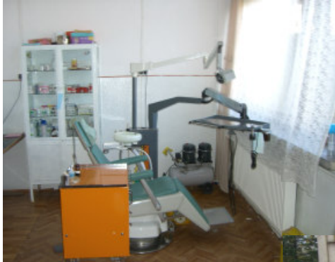
Den gamle tandlægeklinik, bemærk kompressoren i hjørnet.