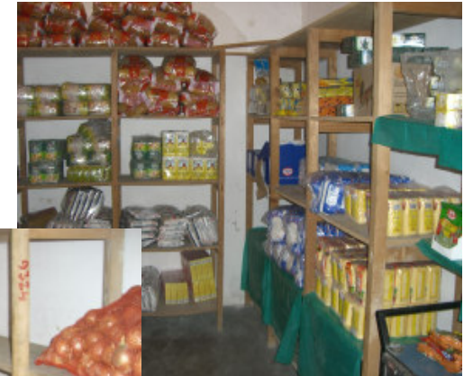
Kartofler, gulerødder og løg i store mængder