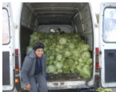
Indkøb af hvidkål

Tilbage på hospitalet begyndte aflæsningen af alle fødevarerne. En af de ældre ansatte gentog flere gange: „Vores far er tilbage, pater noster er tilbage. Vi har været i Helvede“.