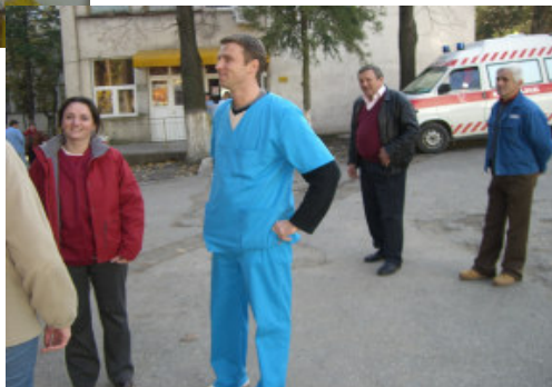
Tandlæge og assistent (i blå uniform fra Danmark)