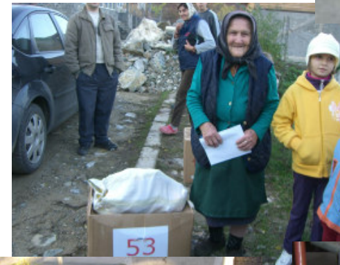
Pakkefest den 14.11.2009