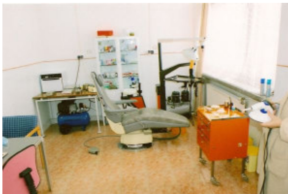
og den nye