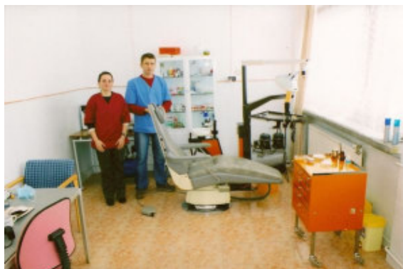
En glad og stolt tandlæge med sin klinikassistent. De sender begge en stor tak til Lions Club Suså