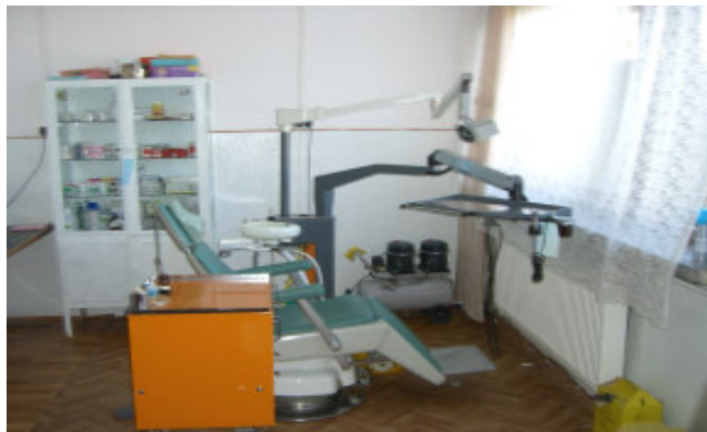
Den gamle klinik

er nu renoveret og taget i brug. Væggene er malet, og der er kommet fliser på gulvet.