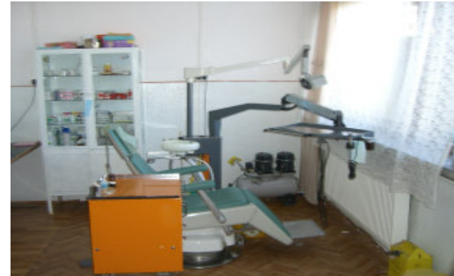
Den gamle klinik

er nu renoveret og taget i brug. Væggene er malet, og der er kommet fliser på gulvet.