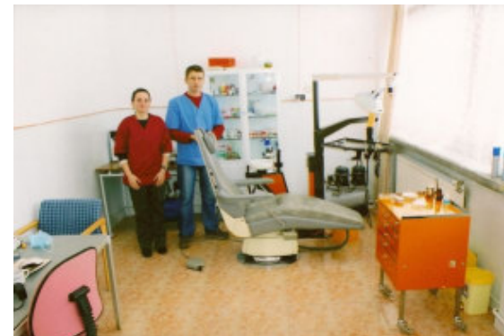
En glad og stolt tandlæge med sin klinikassistent. De sender begge en stor tak til Lions Club Suså