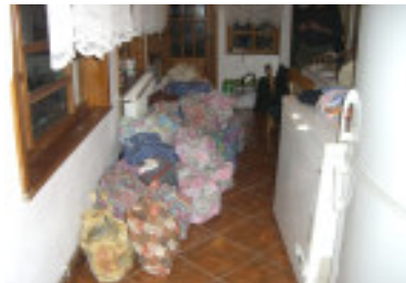
83 poser fylder nu en hel del