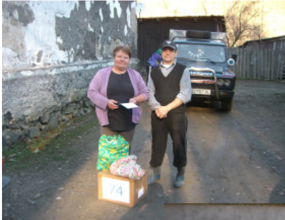
Bilen i baggrunden tilhører en kræmmer, der kørte rundt og falbød sine varer. Han blev lidt sur, hvis vi holdt i vejen og sinkede hans handel