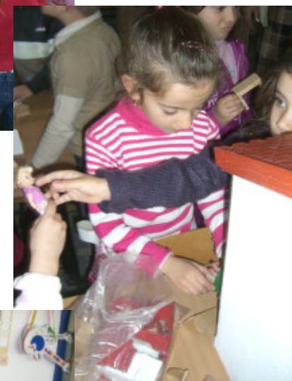
Billeder fra børnehave nr. 1