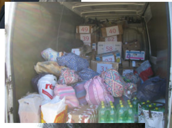
og så er vi klar til at besøge familierne i Dubova