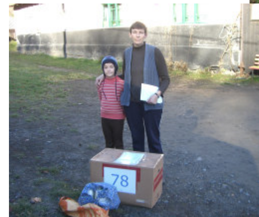
Fam. i Baia Noua