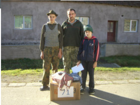
Et skår i glæden - mor var indlagt på hospitalet

Alt gik strygende. Vi var færdige i Eibenthal og Baia Noua omkring middagstid og vendte derfor igen næsen mod Dubova.