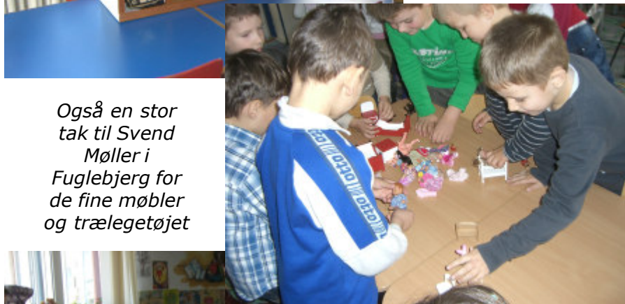
Også en stor tak til Svend Møller i Fuglebjerg for de fine møbler og trælegetøjet