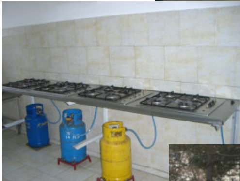
De gamle blus med gasflasker nedenunder

afløses nu af en udendørs gastank. Der er netop givet tilladelse til at tage tanken i brug.