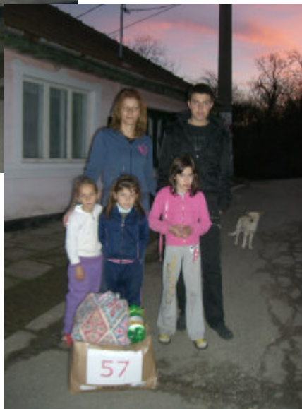
Mørket falder på, og vi må fortsætte søndag