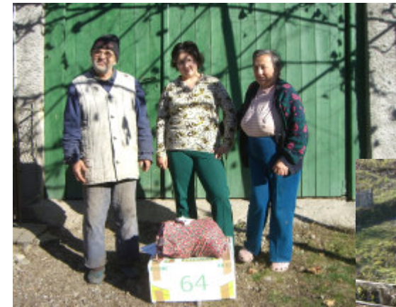
Fam. i Eibenthal