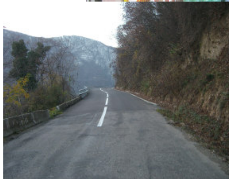
Den nye flotte vej mellem Dubova og Eselnita