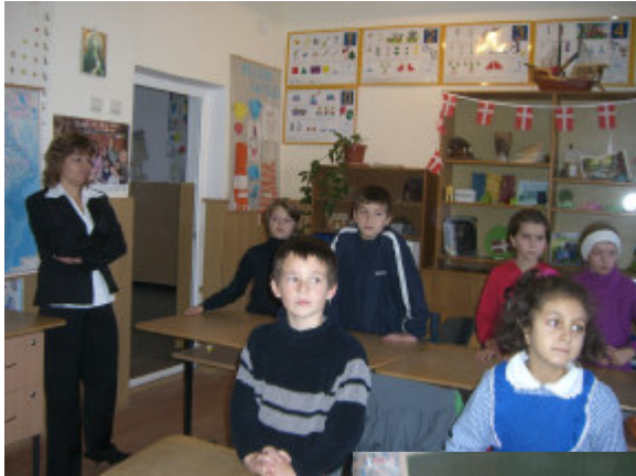
Guirlande med Dannebrog er hængt op i reolen