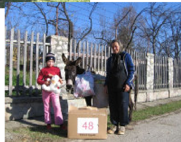
Mormor og barnebarn med familiens eneste transportmiddel

Vi vendte nu tilbage til vores pension, hvor vi var indbudt til datterens 17-års fødselsdag. De unge gæster sad ved et langt bord. Vi blev bænket ved et andet sammen med familien.