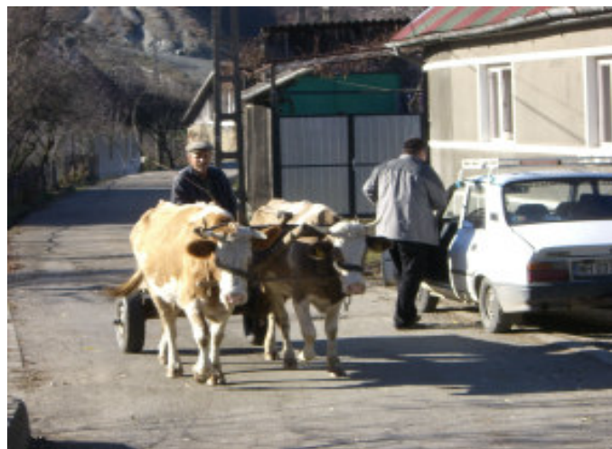
Godt, vi skulle rundt i bil med alle vore poser og pakker