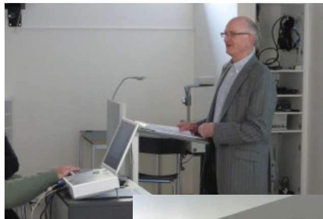
Formanden byder velkommen til årsmødet 2011

Vi havde desværre nogle tekniske problemer med vores billedmateriale i sidste Nyhedsbrev. De er løst, så her kan vi genopfriske mødet: