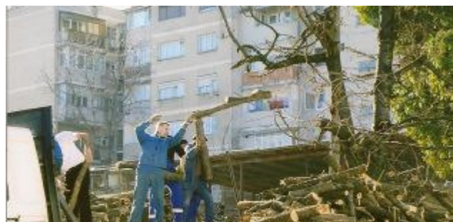
Nu er det bare med at få læsset af