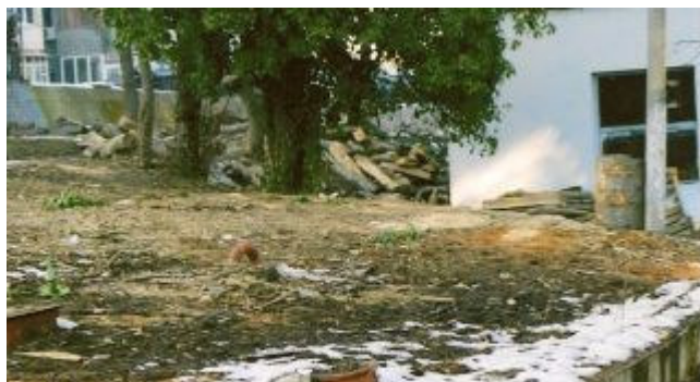
Gabende tom plads

Vi skylder Brand af 1848 Fond og Lions Club Suså en rigtig stor tak for deres velvilje.