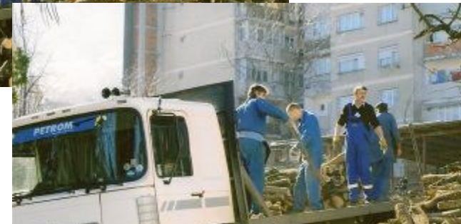
Der er godt nok lang vej endnu