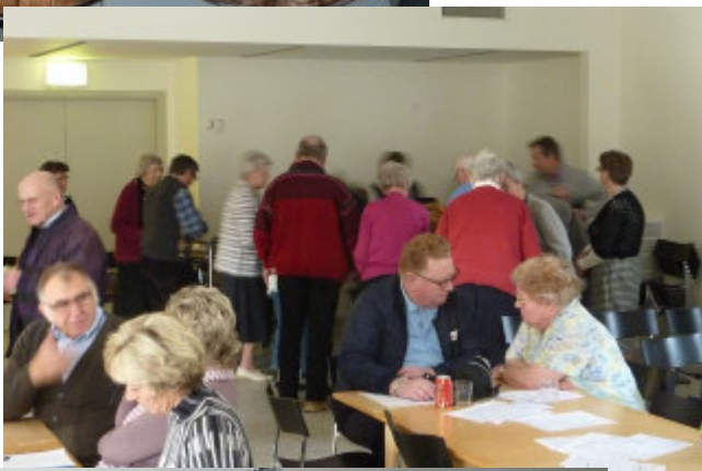
Så er kaffe- bordet åbnet