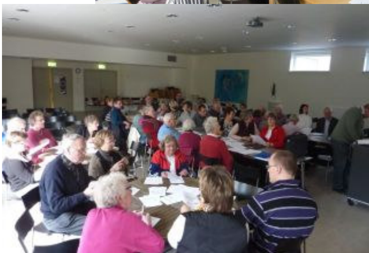
Dejligt med så stor interesse for årsmødet