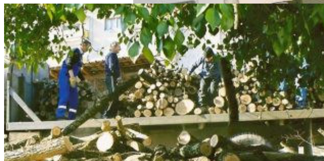
Vi kan godt holde varmen