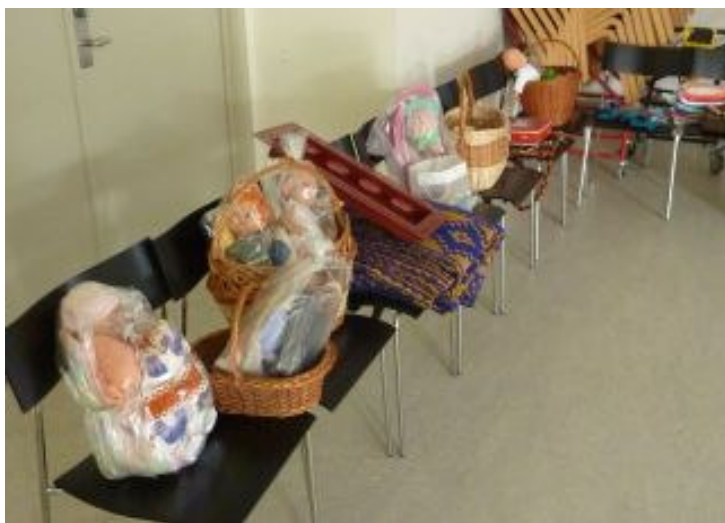
En del af de mange effekter, der blev solgt på auktionen