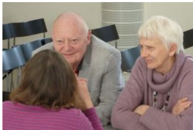
Er det mon de rumænske familier, der drøftes hen over bordet?