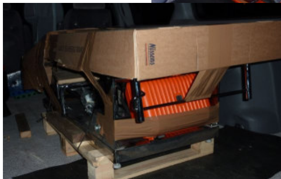
Klar til forsendelse