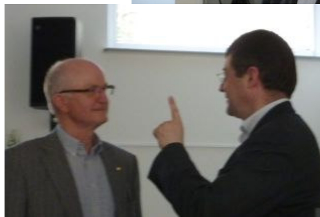
Det hænger nu altså sådan sammen...