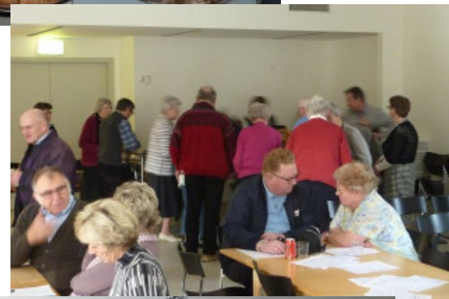
Så er kaffe- bordet åbnet