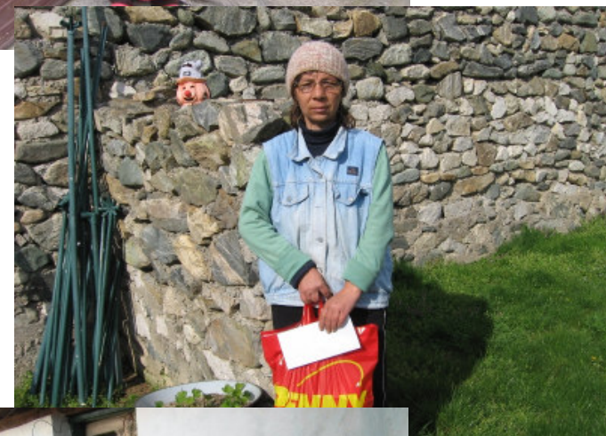
være med til