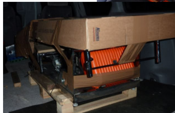
Klar til forsendelse