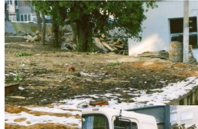
Gabende tom plads

Vi skylder Brand af 1848 Fond og Lions Club Suså en rigtig stor tak for deres velvilje.