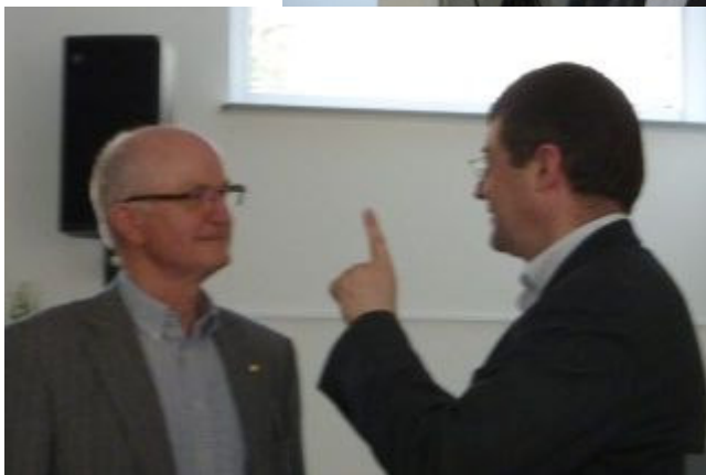
Det hænger nu altså sådan sammen...