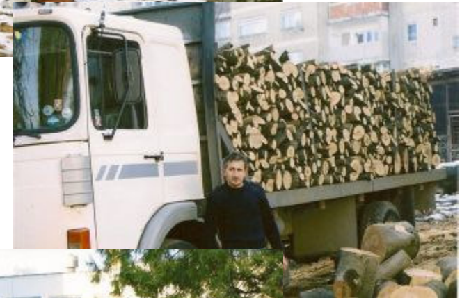
Så kommer der brænde, både på forvogn...