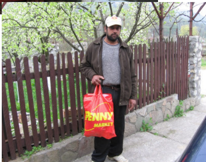
sådan en pose