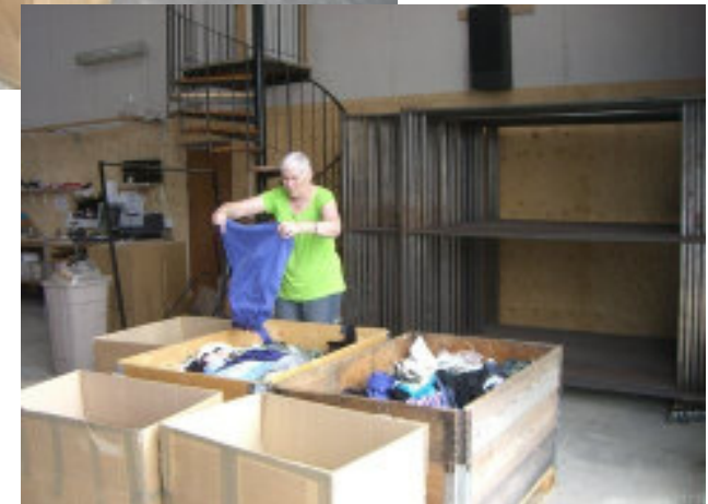
kassereren pakker tøj, og webmaster fotografere