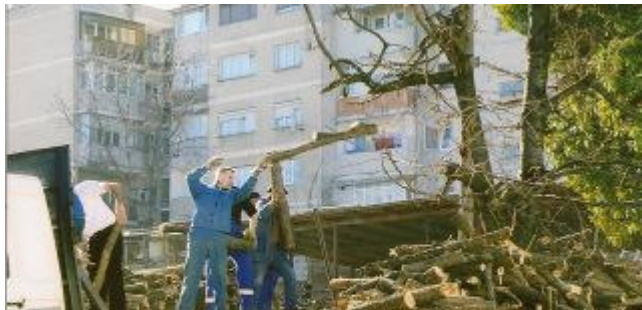
Nu er det bare med at få læsset af