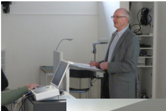
Formanden byder velkommen til årsmødet 2011

Vi havde desværre nogle tekniske problemer med vores billedmateriale i sidste Nyhedsbrev. De er løst, så her kan vi genopfriske mødet: