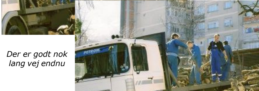
Der er godt nok lang vej endnu