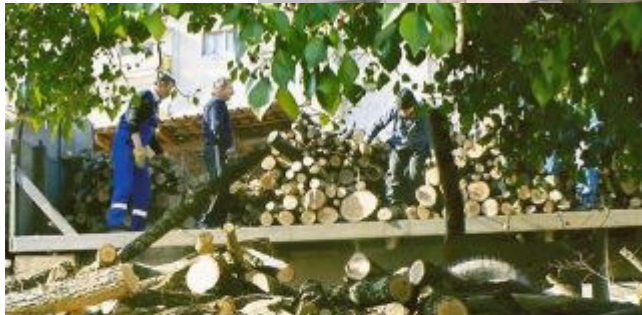
Vi kan godt holde varmen