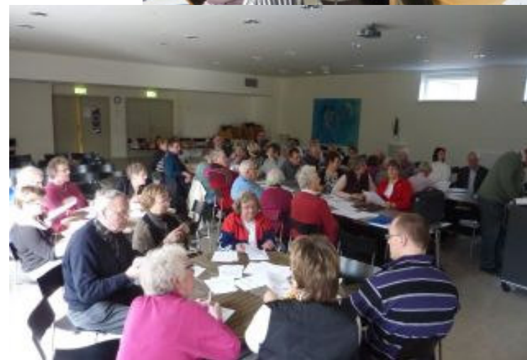
Dejligt med så stor interesse for årsmødet