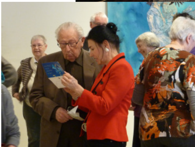
Hjælp til oversættelse af brev fra Rumænien