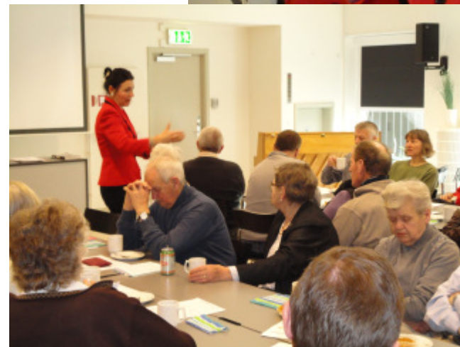
Stof til eftertanke