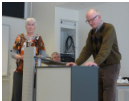
Formand og kasserer aflægger beretning og regnskab

De månedlige adoptionspenge på 120,00 kr. er tillagt 15,00 kr. som går til nødvendige omkostninger, hvilket har fungeret fint. Det blev kørt med to vogne på årets juletur. Takket være bl.a. god styring af juleturen og velvillige tilskud fra bl. a. Lions Club Suså kunne der konstateres et driftsoverskud på 8.115 kr. mod sidste års underskud på 4.550 kr. Der er indkommet ekstraordinære gaver på ca. 15.000 kr. Kassereren redegjorde for Sain Mairian kontoen på 12.000 kr. ifølge gavebrev.