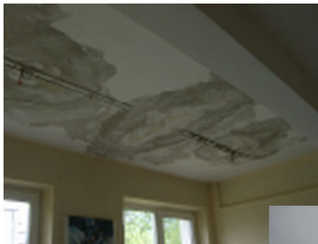
Loftet i køkkenet