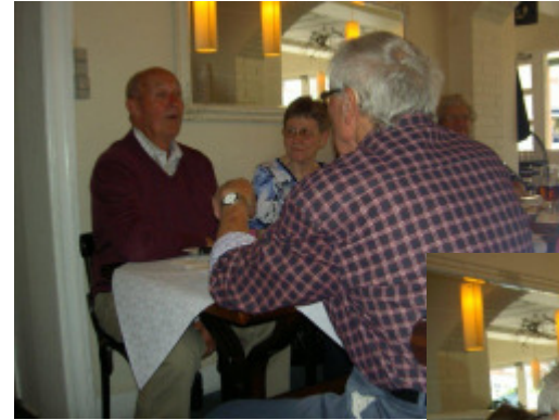
En enkelt lille historie