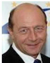
Præsident Traian Basescu