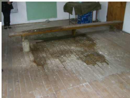
og gulv i genoptræningslokalet