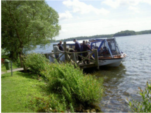
Vi sejler, og vi hilser på Holberg