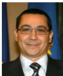
Premierminister Victor Ponta