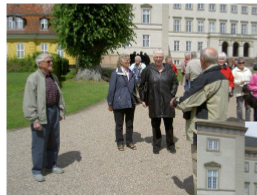
Klar til afgang

Vi brød op ved 20-tiden og begav os hjemad.