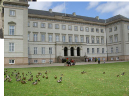
Ænderne tror, det også gælder dem