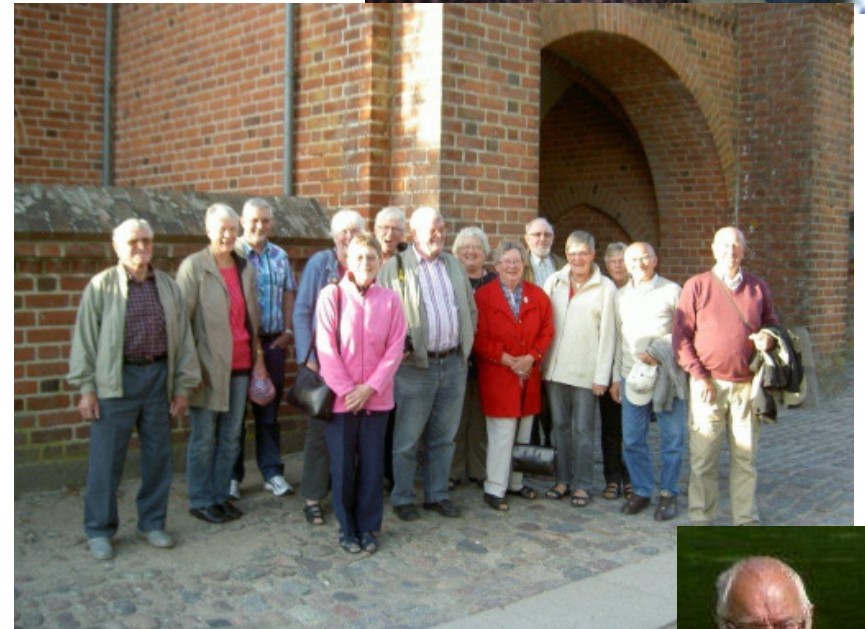
Her er vi så lige før, vi går hver til sit - incl. dagens fotograf