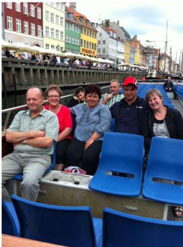
Så sejler vi på kanalerne i København

Genbrugsbutikken blev også besøgt, og der blev handlet flittigt.