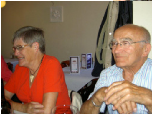
og vi morer os.