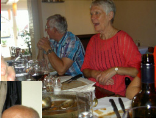
vi hygger os,