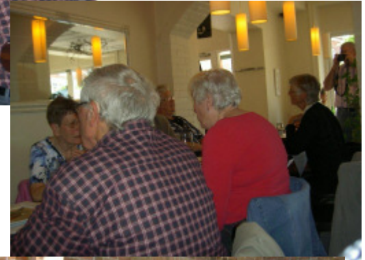
eller to, smutter måske også over bordet