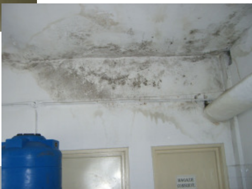
Indgangen til ét af lagerrummene