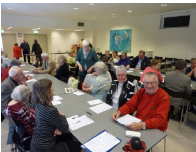
Så er det kaffetid