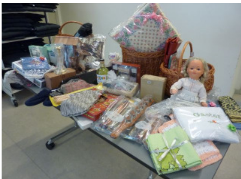
Bordet med alle gevinsterne