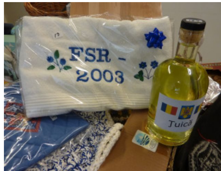
Tina Stub har broderet og skænket det flotte håndklæde