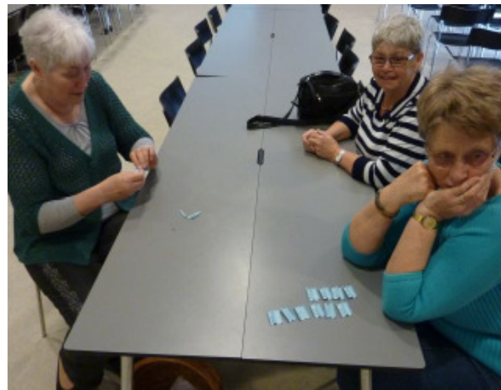
Lodderne gøres klar, inden lotteriet afvikles