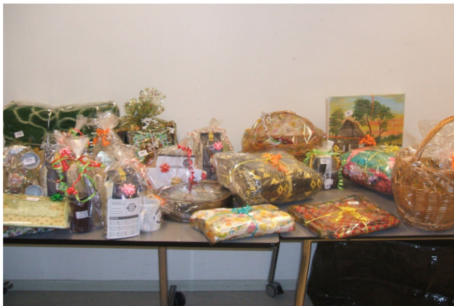
Bordet med gevinsterne til lotteriet

Kaffebordet indbragte 1.570,00 kr. Lotteriet gav 2.250,00 " og så fik vi gavebidrag på 500,00 "