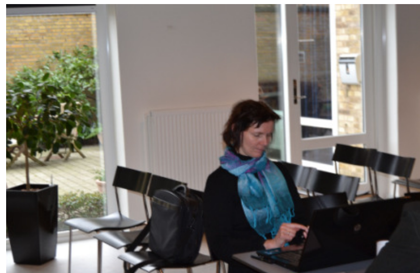
En dybt koncentreret referent