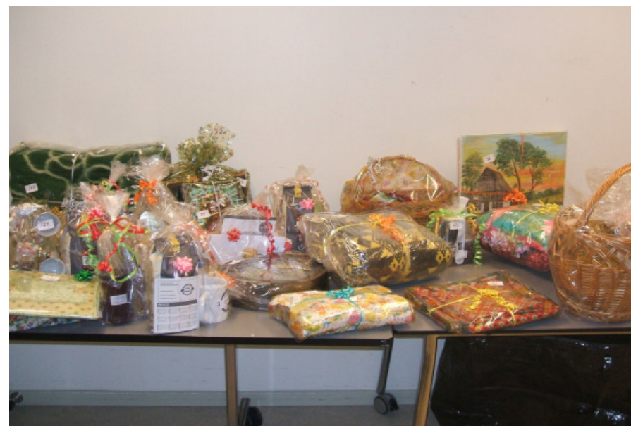
Bordet med gevinsterne til lotteriet

Kaffebordet indbragte 1.570,00 kr. Lotteriet gav 2.250,00 ” og så fik vi gavebidrag på 500,00 ”