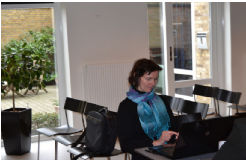
En dybt koncentreret referent