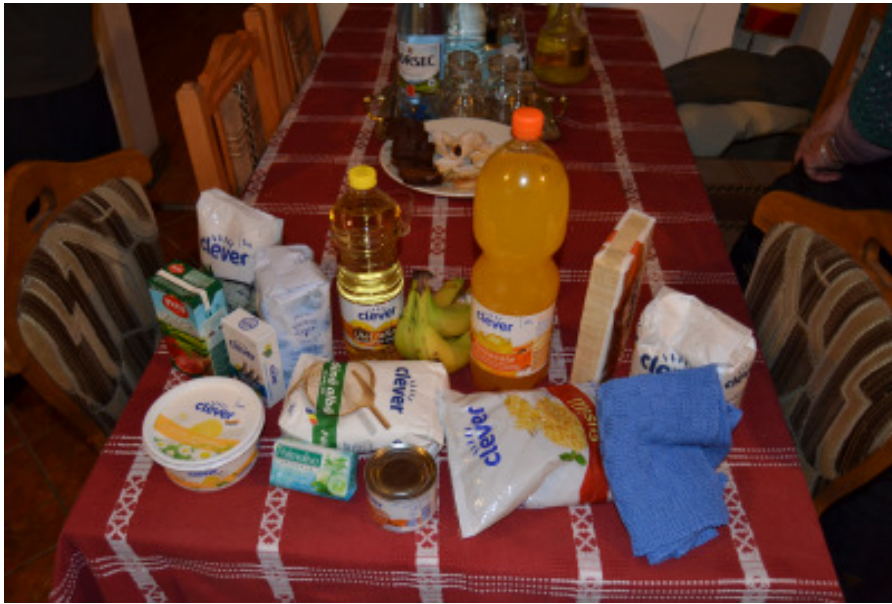
Mulepose november 2014

Dersom der blandt vore medlemmer er nogen, der har lyst til at give et bidrag til disse muleposer, så modtages ethvert beløb, stort som småt, med stor tak.