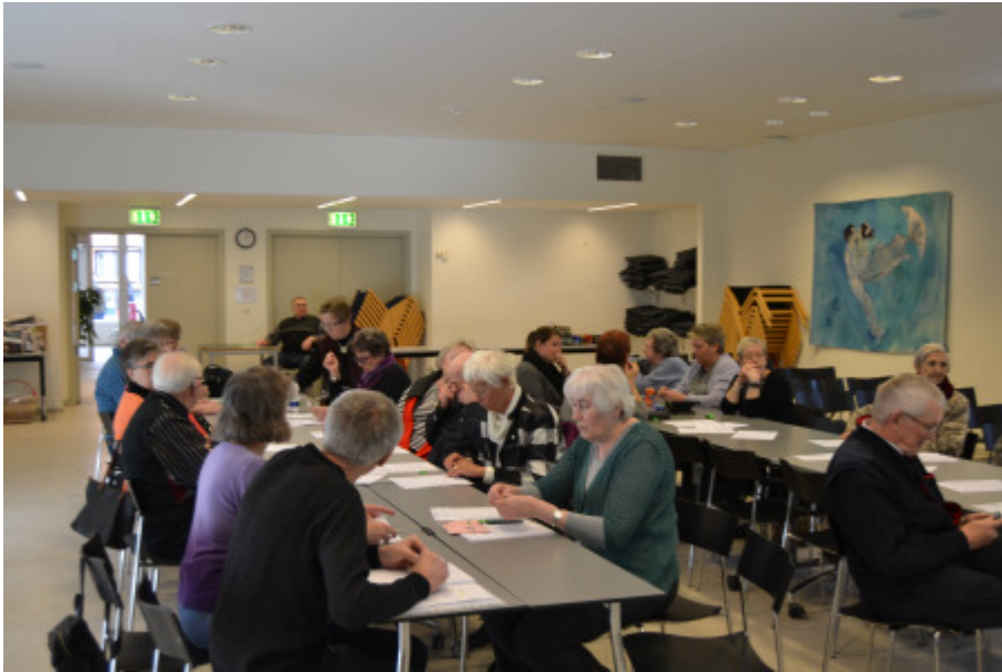
Årsmødet den 12. marts 2016