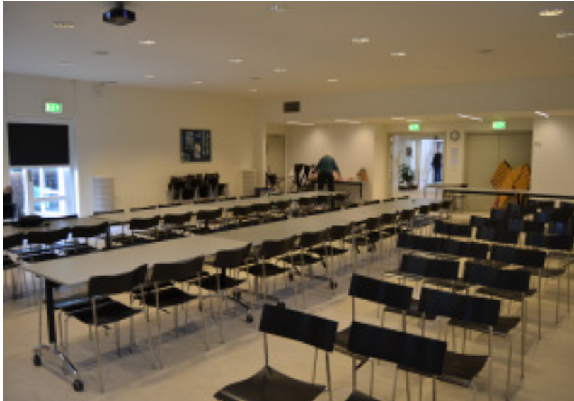
Borde, stole og gevinster til lotteriet er stillet frem - vi kan begynde årsmødet