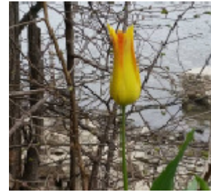
De smukke gule tulipaner, der kun findes nær Dubova, står lige nu i fuldt flor