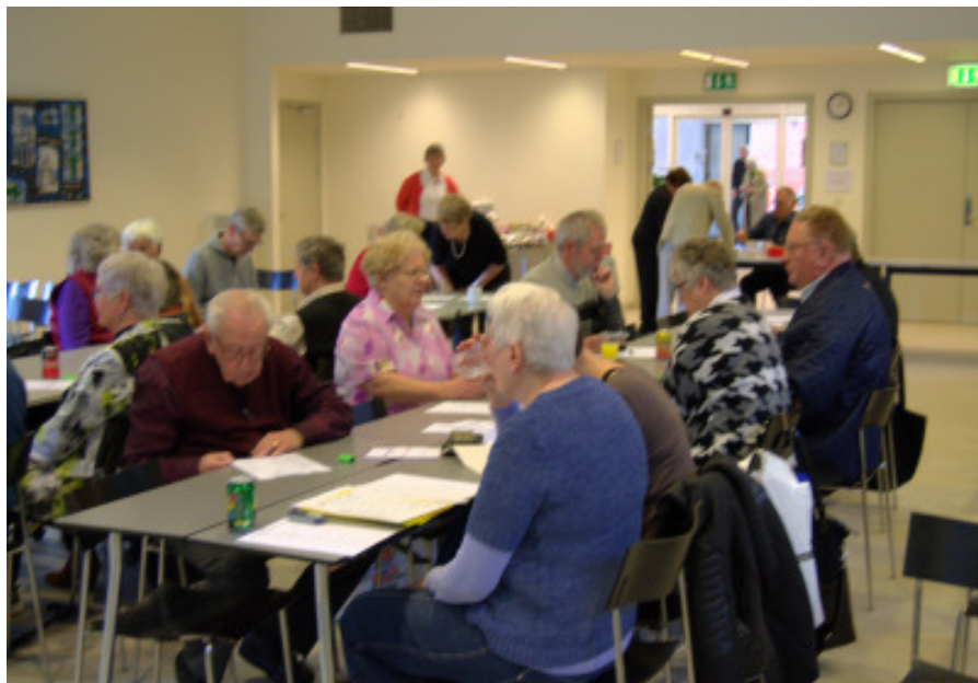
Så venter vi på, at klokken bliver 14