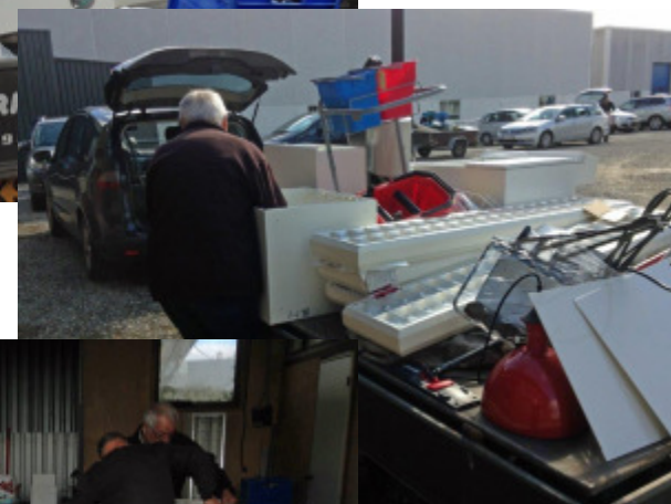
Rotary-folk i Hobro