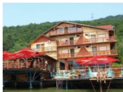
Steaua Dunarii, Eselnita www.steaua-dunarii.ro