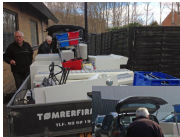
Flere billeder fra