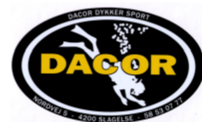
Nordvej 5 4200 Slagelse 58 53 07 77