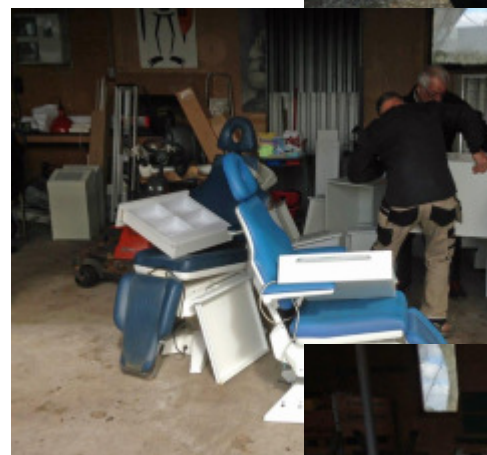
En velfortjent drikkepause