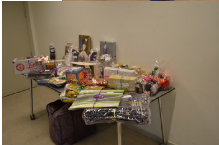
vinde i år