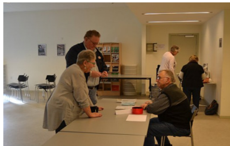
Vagn sælger igen lodder til lotteriet