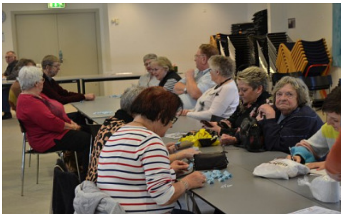
lægges i nummer- orden