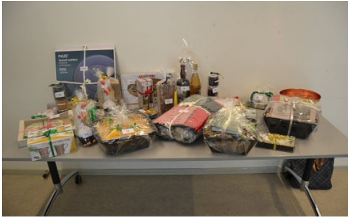
Dette års gevinster