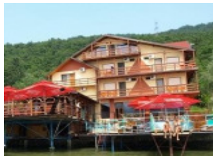
Steaua Dunarii, Eselnita www.steaua-dunarii.ro