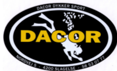
Nordvej 5 4200 Slagelse 58 53 07 77